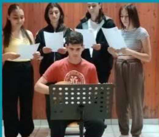
Επιτάφιος Ύμνος του Σείκιλου

Αρμματοποιημένες αναγνώσεις αποσπασμάτων από την Ελένη του Ευριπίδη