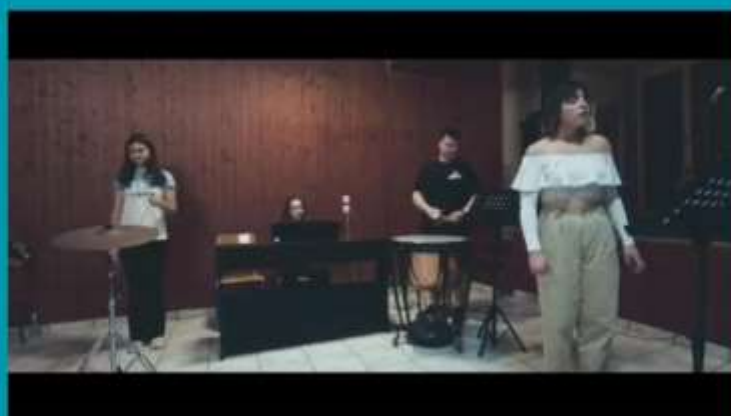
Ρυθμική απόδοση αποσπασμάτων από την Ιλιάδα του Ομήρου